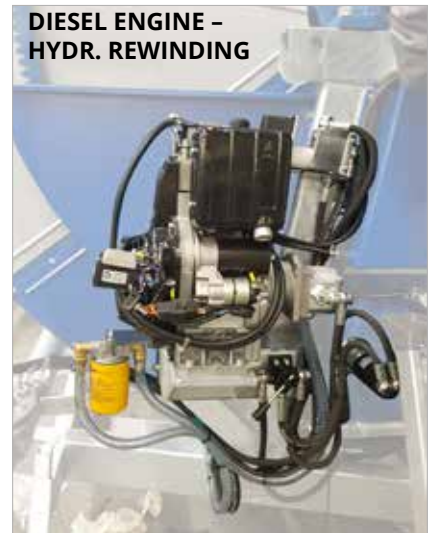
DIESEL ENGINE - HYDR. REWINDING