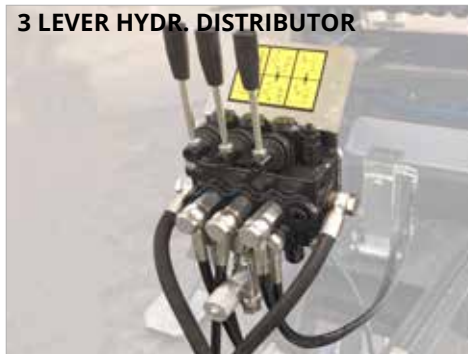
3 LEVER HYDR. DISTRIBUTOR