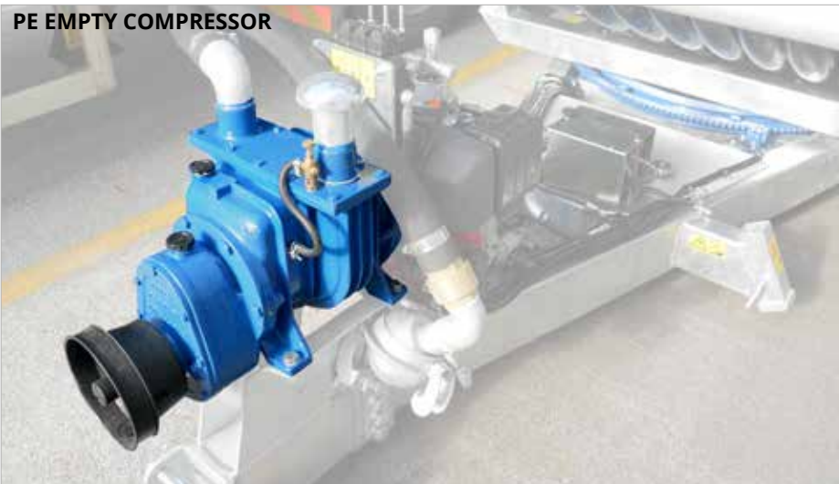
PE EMPTY COMPRESSOR